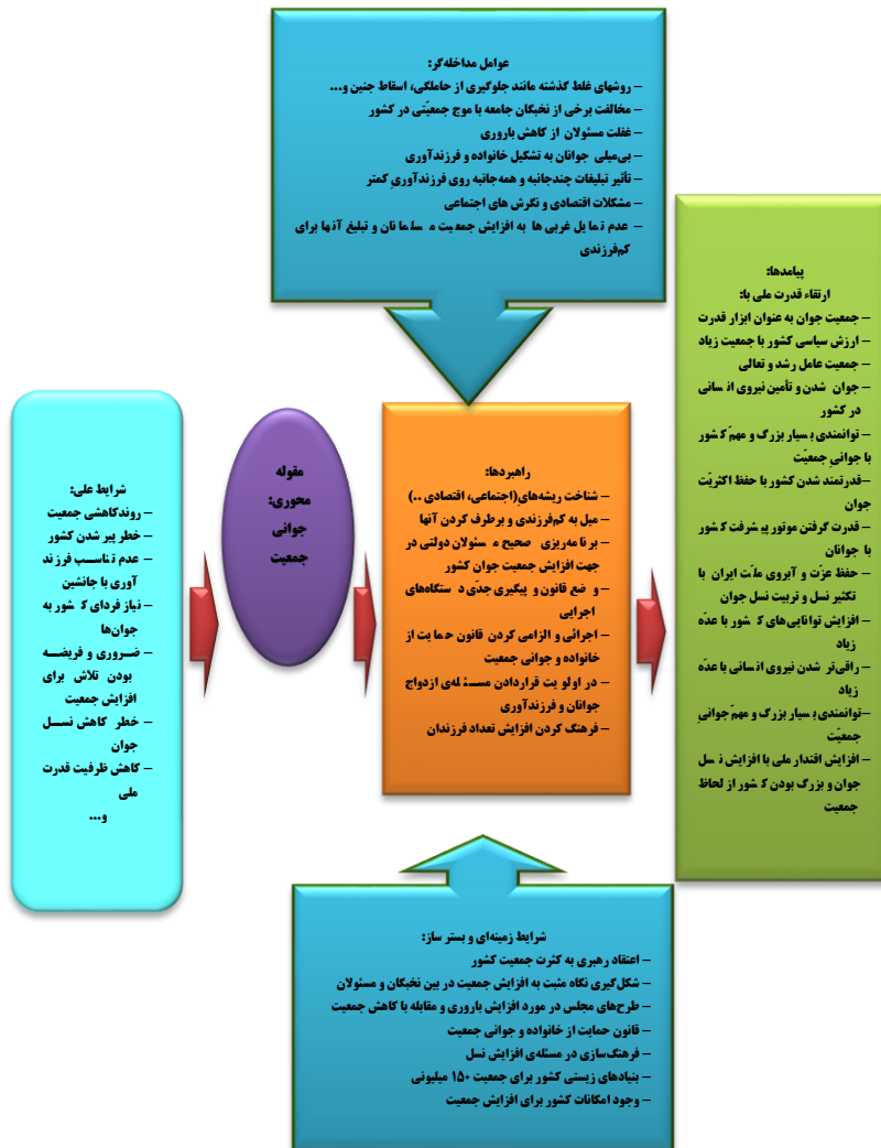
شکل شماره ۲. الگوی ارتباط جوانی جمعیت با ارتقاء قدرت ملی از دیدگاه مقام معظم رهبری (مدظله‌العالی)